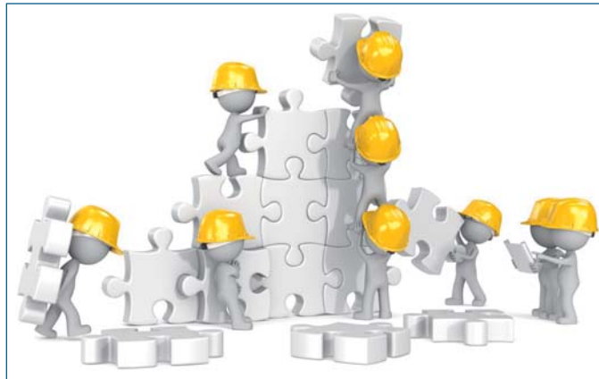
Construction. Dude x 9 the builders at puzzle construction site.