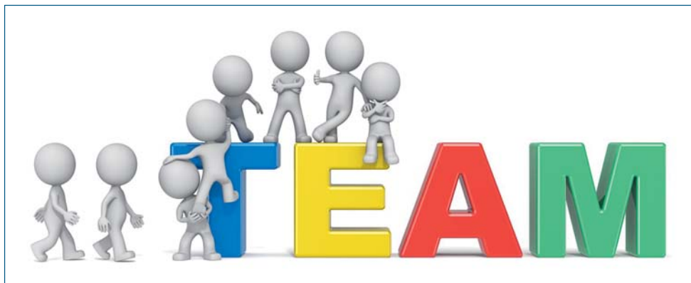
The Team. Dude 3D characters X8 climbing up on letters forming TEAM. Color version.